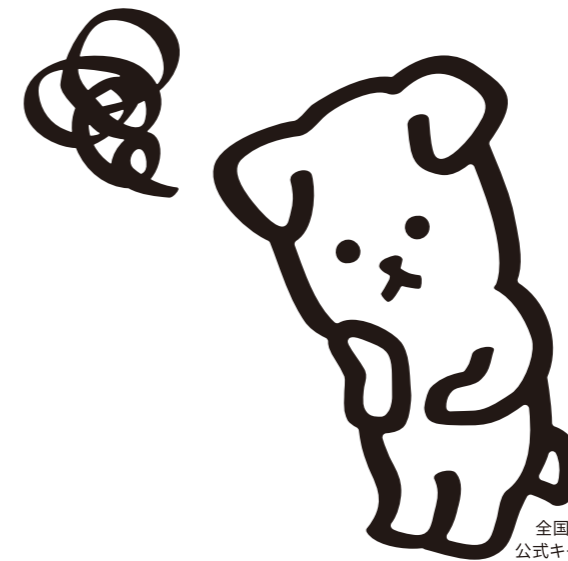
全国儀式サービス 公式キャラクター「しろ」