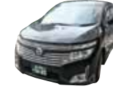
寝台車 車庫から10kmまで